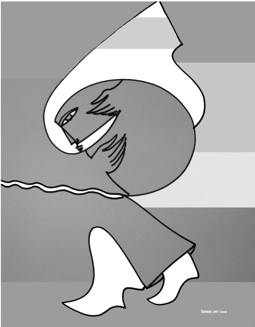
رێبوار سه عید

به لام ئه و شتوژانه هه یجان له گه لیدا سه رکه وتوو نه بوون.