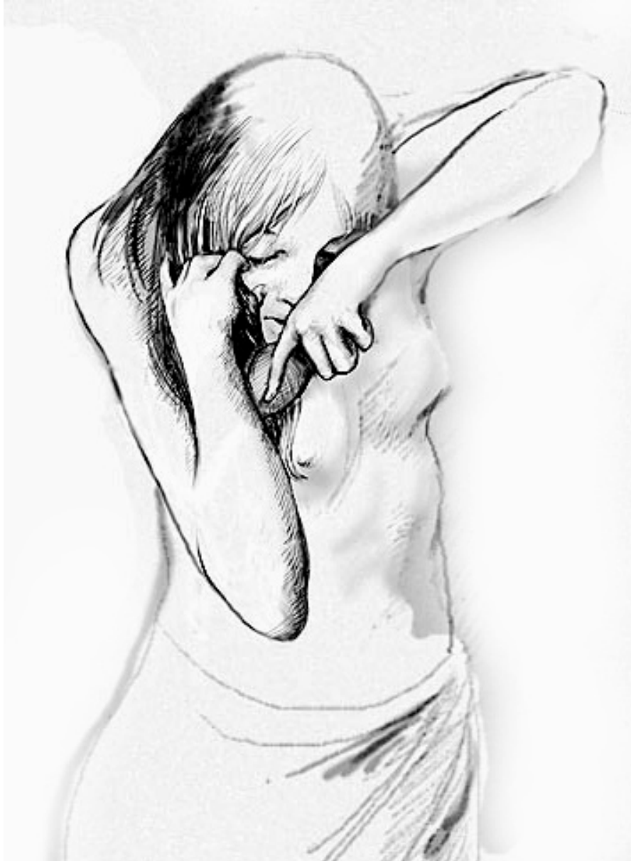
لە ئە ن دە رنێتە وە

دە بی ت سە یی ن سە فەر بکە م، هەر ئە مشو بە لگە نامە رە س مییە کانم دە دە ن س. بۆ م روونکر دە وە، من خۆ م ئامادە نە کردوو بۆ سە فەریکی وە ها، بە لام ئە و بە زۆر سە پا ند ی بە سە رمدا. ناچار داوام لیت کرد کە تۆ ش لە گە ل خۆ م دا بیە م" - "بە لام ئە و وت ی - "برۆ ئە گینا لیت رازی نابم." - "باشە ئە ی من چی بکە م؟" - "تە لە فون بکە بۆ مالی باوکت، با دا یکت بیت و ئە و ماو یە ی من لە سە فەر م لات ب مینیتە وە." چاوەر پیمان کردو هەر ئە و شە وە کیتابو شتی سە فەریان بۆ ئامادە کردو دایانە دە ست ی. ئیتەر گە راپنە وە بۆ ماله وە و جانتای سە فەر م بۆ ئامادە کردو پیدایستی بە کانیم خستە ناوی. بۆ سە یی ن سە عات شە شی بە یانی بە ئوتومبیل بە رە و ئە ر دە ن کە و تە ر ئ. پێش ئە وە ی بروات ئامۆژگاری کردم کە بە هینو ئازا بوم لە مال نە بوونی ئە و کارم تینە کات و ترسم نە بیت، ئینجا ماچیکی سەر روومە تمی کردو رویش ت. منیش بە داویدا دە ستم کرد بە گریان. نزیکە ی نیوسە عاتیک دوا ی رویش تنی فادی، من هە روا بە خە مبار ی دانیش تووم، گویم لە دە نگ راون سستانی ئوتومبیل ی بوم لە بە ر دەرگا.